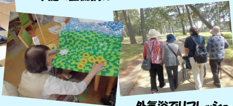
外気浴でリフレッシュ