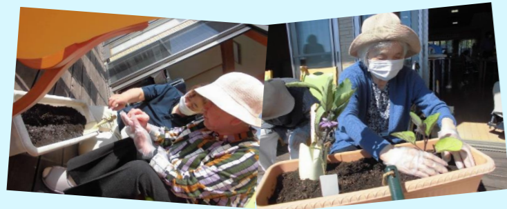
プランターで野菜作り