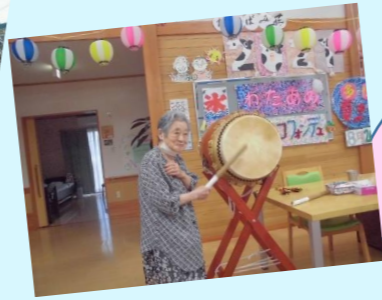
夏祭りでワッショイ