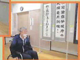
琢成学区文化展作品展示