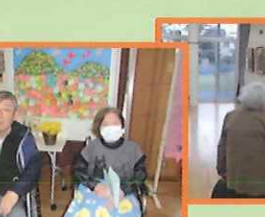
松陵学区文化展作品展示