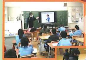
高齢者の視覚・聴覚体験