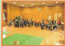
松陵いこいの場「モルック大会」

かたばみ会は、昨年も地域の皆様との関わりを大切にする為、様々な活動を行ってきました。その中でも松陵学区コミュニティ振興会様の「松陵いこいの場」や酒田市社会福祉協議会様の「ふくし出前講座」、酒田市立松陵小学校福祉体験学習、そして琢成、松陵学区コミュニティセンター様での文化展や荘内銀行酒田北支店様への作品展示など、多くの活動の場を提供させていただいております。今年も引き続き、微力ながらお役に立てればと思っております。