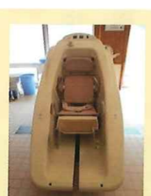
車椅子の方も入浴できる機械浴

前号でもお知らせしたとおり、デイサービスセンターかたばみ荘では、9月1日より障がいのある方も利用できる共生型サービスを開設しました。自宅での入浴が困難な方が安心して入浴できる設備や多彩なメニューで評判のお食事など、充実したサービスで皆様のご利用をお待ちしております。