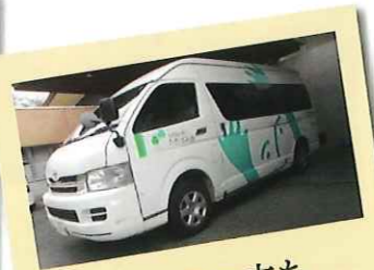
車椅子の方も安心して利用できる送迎車