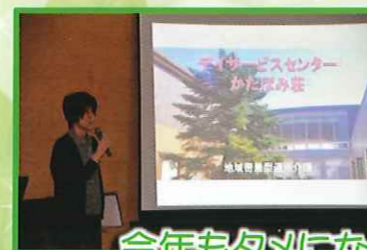
今年も夕メになる講座を用意してお待ちしております。